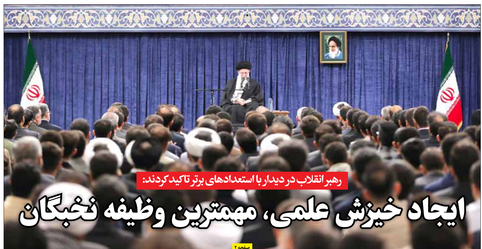
رهبر انقلاب در دیدار با استعدادها ی برتر تاکید کردند:

سه شنبه شب رسانه‌های داخلی رژیم اسرائیل از آغاز حملات موشکی گسترده ایران به داخل سرزمین‌های اشغالی خبر دادند؛ حملاتی که با هدف مشروع پاسخگویی جمهوری اسلامی ایران به نقض حاکمیت و مطابق با حقوق و قوانین بین‌المللی رخ داد و واکنشی از موضع قدرت به اقدامات جنگ طلبانه بنیامین نتانیا هو محسوب شد که با ترور رئیس دفتر سیاسی حماس در تهران و دبیرکل حزب الله لبنان و همراهانش در ضاحیه بیروت، در پی کشاندن آتش جنگ به نقاط دیگر غرب آسیاست... | صفحه ۲