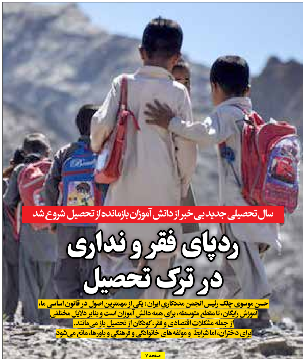
سال تحصیلی جدید بی خبر از دانش آموزان بازمانده از تحصیل شروع شد