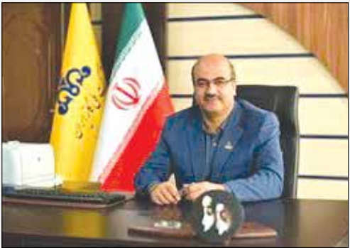
خراسان شمالی / یاسروطن پور

مدیرعامل شرکت گاز استان خراسان شمالی از آمادگی این شرکت