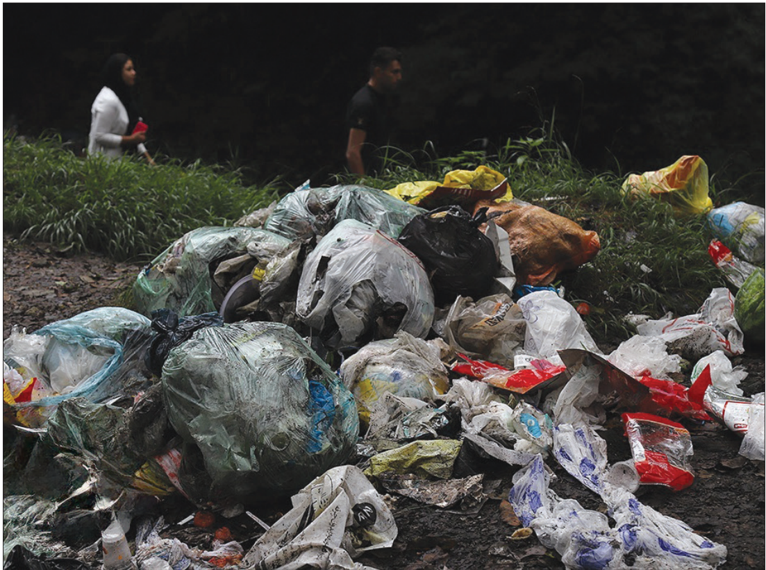
زباله ارمغانی از گردشگران در طبیعت مازندران