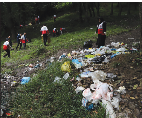
زباله ارمغانی از گردشگران در طبیعت مازندران