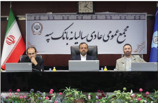
در صورت های مالی این بانک از سال گذشته که باتلاش فراوان حاصل

شد، مشهود است و نه تنها در یکپارچگی و عملکرد بلکه در عبور از شرایط اضطرار اقدامات این بانک به خوبی انجام شده است و می توان انتظار داشت که اامسال و سال های آینده، سال هایی باشد که بانک سپه بتواند در مورد «سپه نو»، به صورت کاملاًحقق شده صحبت کند. وزیر امور اقتصادی و دارایی عنوان کرد: تلاش مادر وزارت اقتصاد کمک به عزم و همتی که مدیران بانک داشتند، چه در افزایش سرمایه ۲۵ هزار میلیارد تومانی و چه بابت مطالبات بانک در حوزه پروژه نانی نو و موضوع مصوبه تسهیل واگذاری شرکت های تابعه بانک ها است. خاندوزی ادامه داد: موضوع افزایش سرمایه در سال ۱۴۰۳ که بتواند