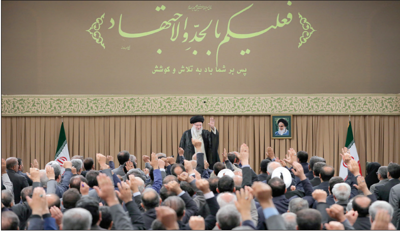
پس بر شما یاد به تلاش و هوش

رهبر انقلاب، موفقیت آقای پزشکیان در مسائل اقتصادی، فرهنگی، بین المللی و دیگر عرصه ها را موفقیت همه خواندند و گفتند: باید همه به رئیس جمهور منتخب در ادای وظایف کمک کنیم و ازین دندن باور کنیم که موفقیت ایشان، پیروزی همه