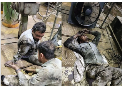
نیروگاه رامین با ایثار و از خودگذشتگی مهندسان آن بدون خاموشی تعمیر شد