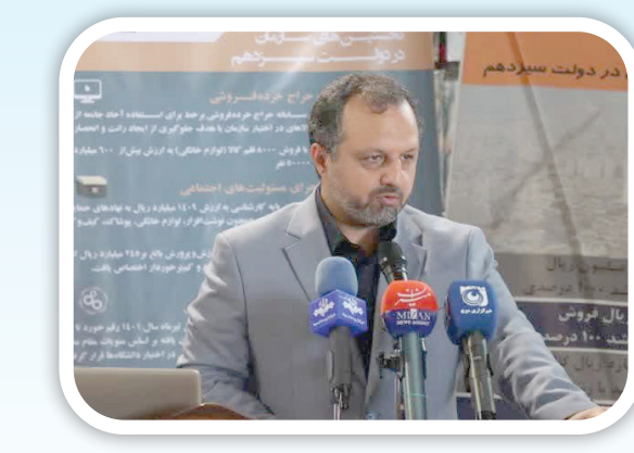
گفت: رونمایی از سامانه سیات که تکلیف قانونی هم بوده اقدام بسیار مناسبی است. وی تصریح کرد: فاز اول این سامانه در سازمان تعزیرات نیز اجرایی شده و کمک می‌کند که اموال به سرعت تعیین تکلیف شود.

محمد اسفندیاری/عاشورا پژوه عاشورا دو صفحه دارد: صفحه‌ای زیبا و صفحه‌ای زشت، و یا صفحه‌ای سفید و صفحه‌ای سیاه، یک سوئگری است که ماقصدها را بیان می‌کند (سیات) و لول قین هاست که بعضی فقط به یک صفحه آن می‌نگرند! آن هم صفحه سخت آن... | صفحه ۸ را بخوانید