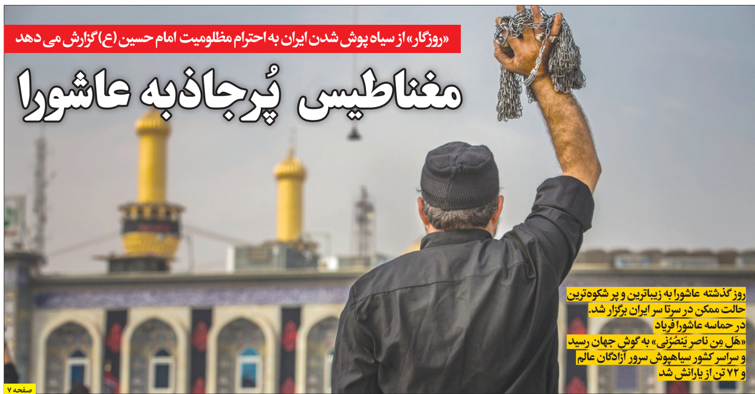
«روزگار» از سیاه پوش شدن ایران به احترام مظلومیت امام حسین (ع) گزارش می‌دهد

۸ آوریل سال جاری جمهوری اسلامی ایران کانون بسیاری از اخبار، تحولات و چالش‌ها بوده است. آوریل صهیونیست‌ها ساختمان کنسولی سفارت ایران در دمشق را بمباران کردند و در مقابل، ایرانی‌ها با حمله بی سابقه پهپادی و موشکی به