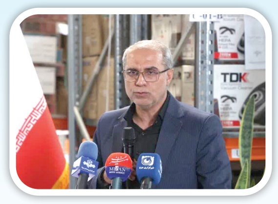
حکم قضایی و در کدام انبار نگهداری می‌شود و امیدواریم این فرایند در دولت آینده ادامه پیدا کند.