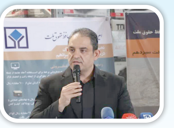
تعیین تکلیف کالاهای اموال تملیکی در دولت سیزدهم ۸ برابر شد