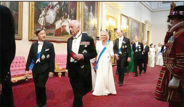
استقبال از امپراتور ژاپن در کاخ بایکنگام لندن