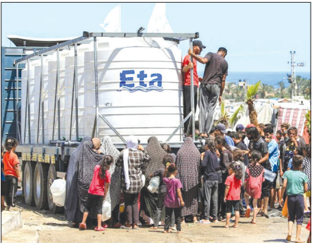
توزیع آب باتانکر در شهر رفح در جنوب نوار غزه

آمریکا از رژیم صهیونیستی است. فارغ از هیاهوی رسانه‌ها و اندیشه‌سکده‌های جریان غربی به نظر می‌آید آمریکایی‌ها در دفاع از مهم‌ترین متحد خود در غرب آسیا لحظه‌ای تردید نخواهند کرد. تنها ساتاتی پس از عملیات «طوفان القاصی»، مقام‌های آمریکایی با سفر به فلسطین اشغالی به جای پرداختن به هفت‌ده مظلم‌ساختاری علیه ساکنان بومی این سرزمین، مجوز قتل عام گسترده مردم غزه را صادر کردند و به بزرگ‌ترین منبع تسلیحات پیشرفته برای ارتش صهیونیستی تبدیل شدند. در ۲۶ روز اخیر دولت‌مردان آمریکایی به دلیل واکنش افکار عمومی جهان اسلام و ترس از تحریم انتخابات ازسوی نیروهای ترقی‌خواه سعی کردند خود را حامی مردم غزه و برقراری آتش پس‌نشان دهند. اکنون سناریوی جنگ غزه به شکل متفاوتی در حال تکرار در جبهه لبنان است. با وجود نمایش سیاسی خاموش‌خوش‌ناشین - استغنا سزورنه، در میدان عمل مقام‌های آمریکایی چراغ سبز حمله به لبنان را نشان دادند و در حال انتقال ناو‌ها - جنگنده‌های خود به شرق مدیترانه برای کمک به سامانه پدافندی رژیم صهیونیستی هستند. اگر واشنگتن بخواهد از خط قرمز مقاومت عبور کند و وارد درگیری مستقیم با مقاومت لبنان شود، آن‌گاه نیروهای این کشور در عراق، سوریه، خلیج فارس، دریای سرخ و مدیترانه امنیت نخواهند داشت و باید هر لحظه آماده حملات موشکی - پهپادی محور مقاومت باشند.