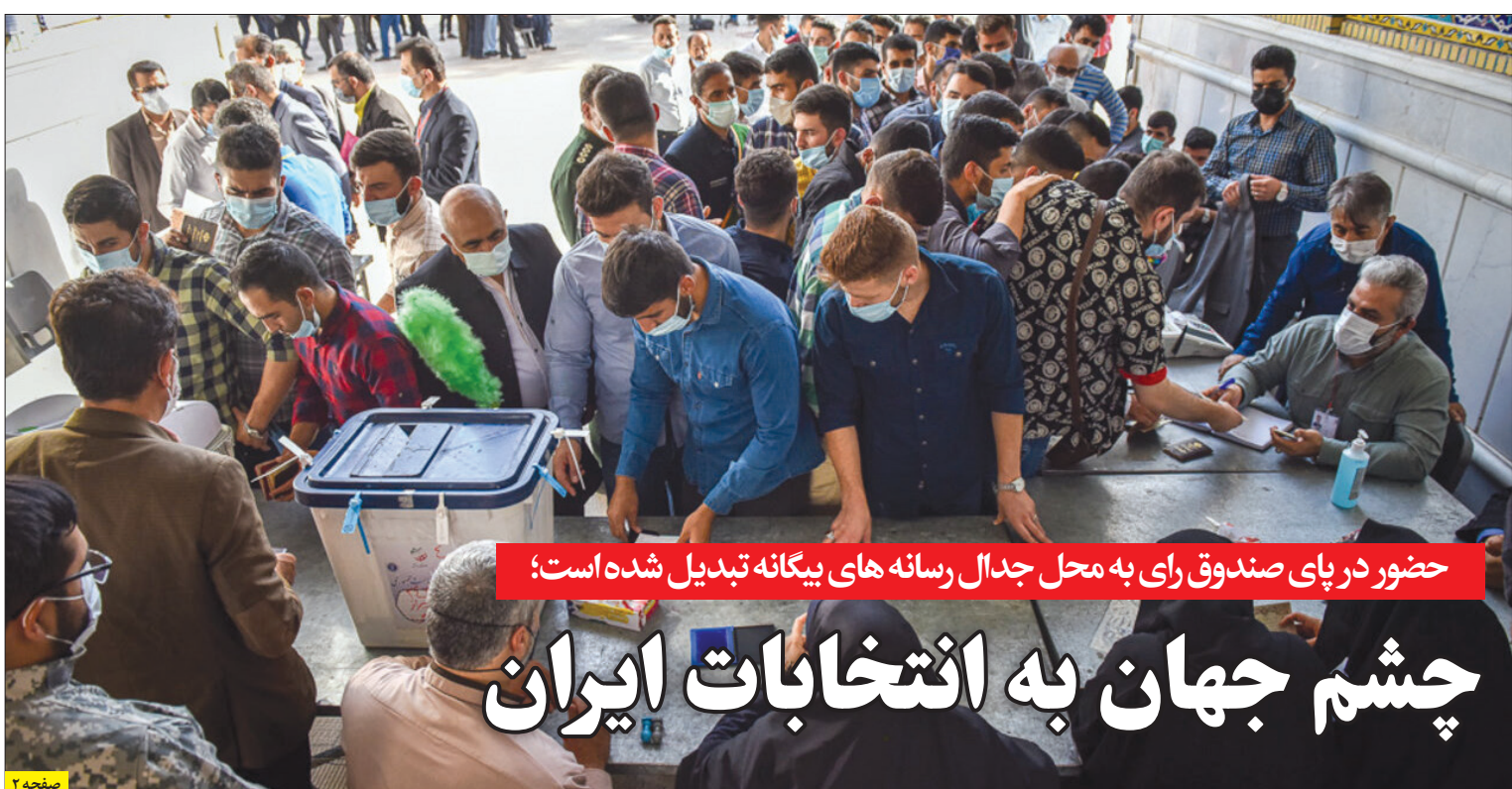
حضور در پای صندوق رای به محل جدال رسانه های بیگانه تبدیل شده است؛

بر اساس خبرها در ۲ سال گذشته، ۲ هزار موضوع توسط سازمان بازرسی شناسایی شد که هر کدام می تواند زمینه ساز فساد باشد. با شناسایی و ارزیابی همه جانبه حدود این مسایل، بیش از ۲۰۰ گلوگاه فساد شناسایی و مشخص و این گلوگاه ها به همراه علل، عوامل و راهکارهای رفع آن در گزارشی به سران قوا اعلام شد... | صفحه ۷