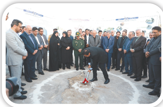
ایمن‌سازی ورودی شمال غربی کلان شهر شیراز

ریال کلنگ زنی شد. گفت: احیای مجموعه تاریخی زندیه از پروژه‌های مهم برای مردم و علاقه‌مندان به شیراز است.