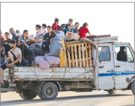
کوج اجباری خانواده‌های فلسطینی از شهر رفح در جنوب نوار غزه

خبرنگار روزنامه «هآرتص» به نقل از «یشایاهو لیویویتز»، دانشمند برجسته صهیونیستی می‌نویسد «آخرین مرحله، و حشگیری اسرائیل است که به پایان صهیونیسم منجر خواهد شد، و در عین حال خودش استدلال می‌کند که «سقوط نهایی اسرائیل» صرفاً به زمان بستگی دارد و شمارش معکوس در این خصوص آغاز شده است. «نیر هاسون» خبرنگار روزنامه هآرتص که روز چهارشنبه در راهیمیایی تحریک‌آمیز «برجم» در قدس اشغالی شرکت کرده بود و از قضا طی همین مراسم توسط تعدادی نوجوان مورد حمله قرار گرفت، از حال و هوای خشونت‌آمیز و زشت این راهیمیایی می‌نویسد: «وحشیگری به اوج خود رسیده است. روحیه عوام، روحیه انتقام جویی بود و شعارهای ضد اعراب سرد داده می‌شد.»