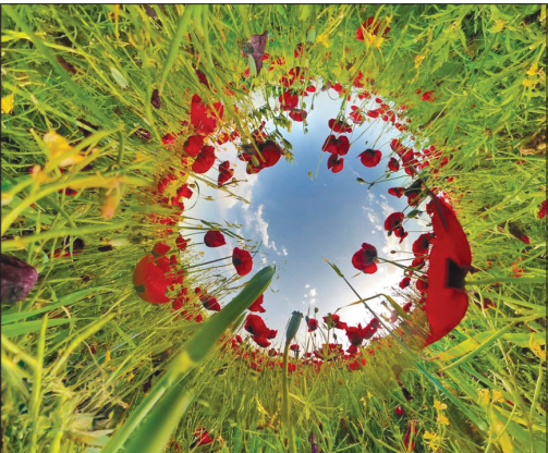
شقایق‌های دل انگیز «قره داغ»