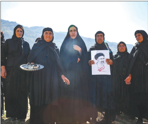
عزاداری بی بی گل برای سید ابراهیم رئیسی