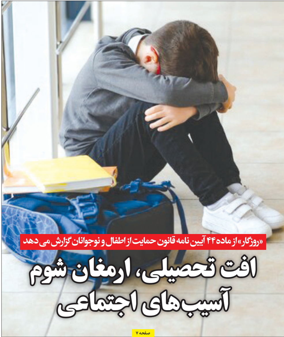
«روزگار» از ماده ۴۴ آیین نامه قانون حمایت از اطفال و نوجوانان گزارش می دهد