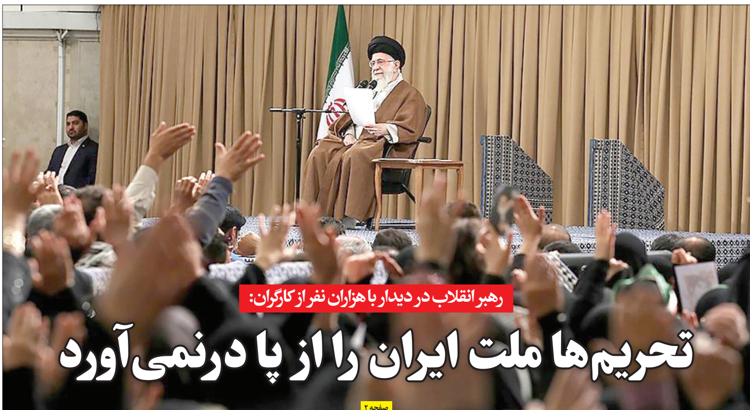
رهبر انقلاب در دیدار با هزاران نفر از کارگران: