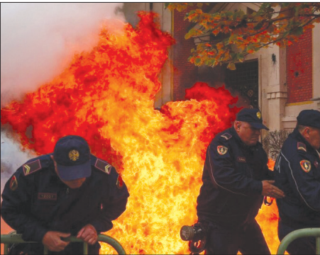
پرتاب کونکشل مولوتف از سوی مخالفان حکومت آلبانی به سمت پلیس در شهر آلبانی