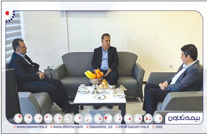
بیمه تعاون www.taavon-ins.ir | www.drbime.com | taavonins.co | info@taavon-ins.ir | 1602