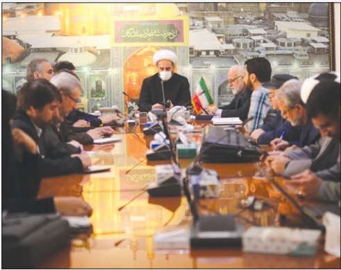
پیش می‌رفت، روز قدس به عنوان یک ابتکار توسط امام خمینی «ره» مطرح شد.

وی با بیان اینکه امروز به برکت انقلاب اسلامی ایران، اندیشه مقاومت در فلسطین ارتقاء پیدا کرده است، افزود: روز قدس ظرفیتی است که هم تجدیدبیعت با مقاومت و آرمان فلسطین باشد و هم برانگیز از ظالمان و مستکبران محسوب شود. معاون فرهنگی، اجتماعی و زیارت‌اندازی خراسان رضوی با اشاره به حمله وحشیانه رژیم صهیونیستی به ساختمان کنسولی ایران در دمشق و شهادت تعدادی از فرماندهان و افسران سپاه پاسداران ادامه داد: اقدام غیرانسانی رژیم صهیونیستی در حمله به ساختمان کنسولگری ایران در دمشق به نحوی بود که نهادها و بنیادهای مدعی حقوق بشر که حمایت‌های زیادی از رژیم صهیونیستی داشته‌اند، در همان ساعات اولیه آن رامحکوم کردند. وی در خصوص راهپیمایی روز قدس اضافه کرد: یک هم‌افزایی برای در کنار هم قرار دادن ظرفیت‌های مردمی و رسانه‌ها برای حضور و اطلاع‌رسانی این رویداد مهم باید شکل بگیرد.