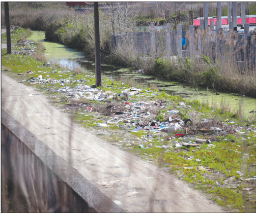
ردپای کثیف مسافران نوروزی در گیلان و گلستان