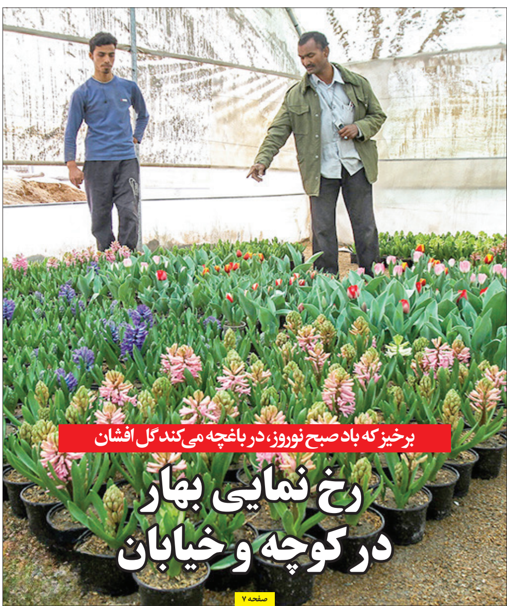
برخیز که باد صبح نوروز، در باغچه می‌کند گل افشان