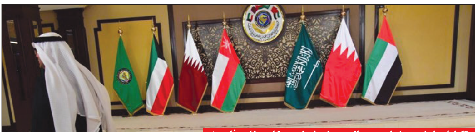
تکرار ادعاهای بی اساس در بیانیه وزیران شورای همکاری خلیج فارس؛

بر اساس قانون بودجه سال جاری هنرمندان چهار برابر حقوق‌بگیران از معافیت مالی بهره‌مند شده‌اند، در چنین وضعیتی این سؤال مطرح می‌شود: چرا بین پرداخت‌کنندگان مالیات چنین تبعیضی وجود دارد؟ مالیات همواره یکی از منابع ثابت