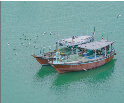
ساحل زیبای بریس