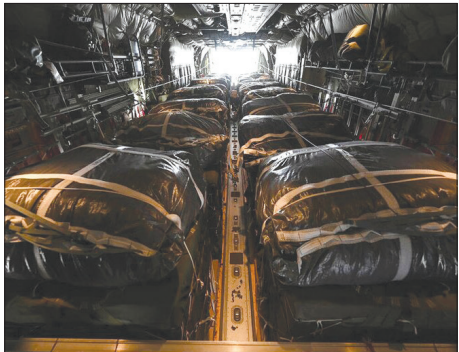
ارسال محموله های غذایی از طریق هواپیمای باری سی ۱۳۰ ارتش آمریکا بر فراز آسمان نوار غزه

طبق گفته این منابع، مصر معتقد است که درخواست حماس برای بازگشت آوارگان به شمال غزه، ورود کمک ها و آتش بس فراگیر، «منطقی» است.