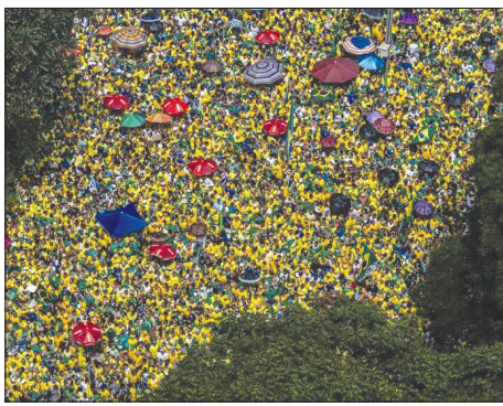
راهپیمایی طرفداران ژانیر بولسونارو رئیس جمهور اسبق برزیل در ساوتائولو