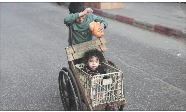
زندگی سخت کودکان فلسطینی سوزان این عکس اثرگذار شده است/ رفع، سرزمین‌های اشغالی