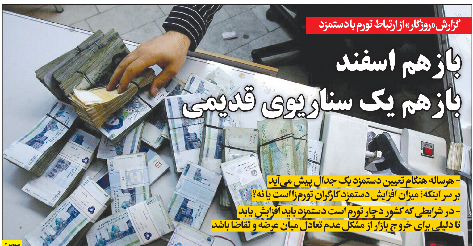
گزارش «روزگار» از ارتباط تورم با دستمزد