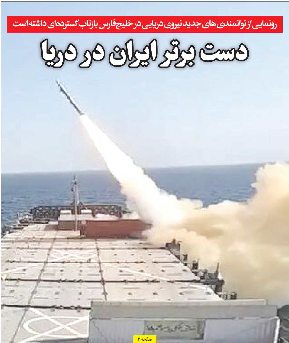
رونمایی از توانمندی های جدید نیروی دریایی در خلیج فارس با تازاب گسترده ای داشته است