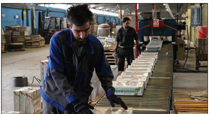
گزارش «روزگار» از تبعات گسترش پدیده حق العمل کاری