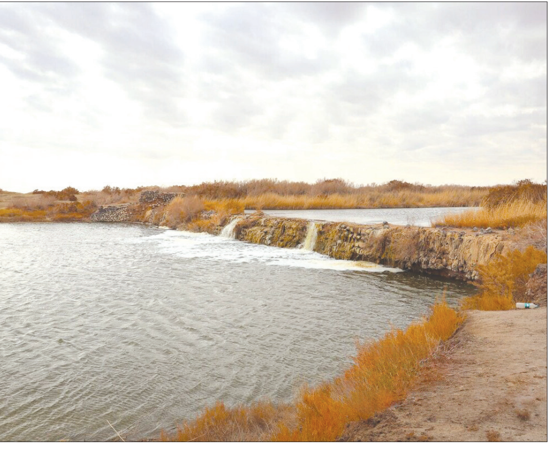
نفس‌های آخر تالاب گاوخونی