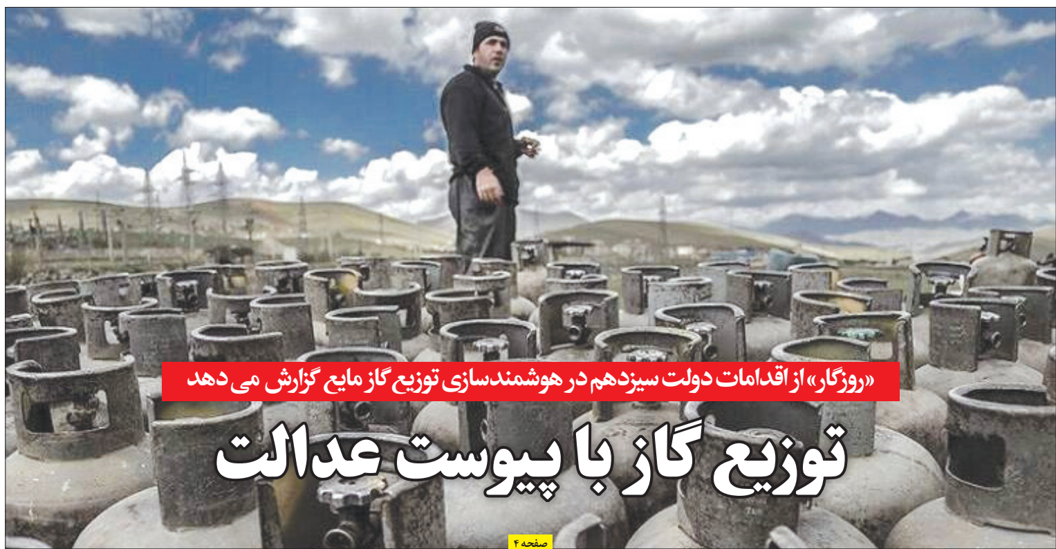
«روزگار» از اقدامات دولت سیزدهم در هوشمندسازی توزیع گاز مایع گزارش می دهد

نیمه شب جمعه ۱۳ بهمن ماه، آمریکا حملات گسترده ای را علیه گروه مقاومت داخل خاک عراق و سوریه آغاز کرد؛ حمله ای که به گفته مقام های ارتش این کشور حدود ۳۰ دقیقه طول کشیده است. طی این حمله، ۸۵ موضع و پایگاه در چهار منطقه عراق و سه منطقه سوریه، هدف ۱۲۵ مهمات «هدایت شونده و دقیق» قرار گرفت. این حملات آمریکا، به عنوان پاسخی انتقامی در نظر گرفته می شود.... | صفحه ۲