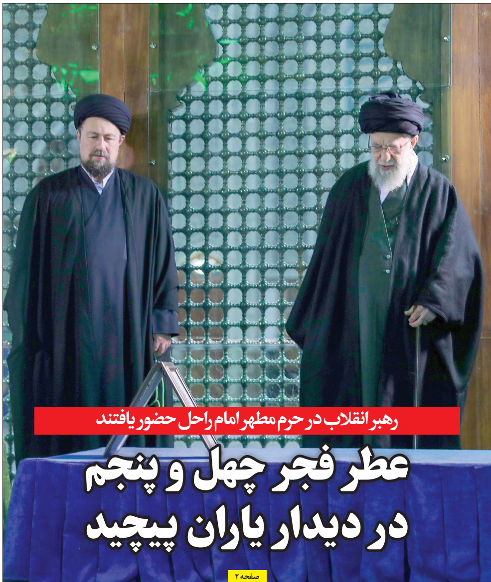
رہبر انقلاب در حرم مطہر امام راحل حضور یافتند