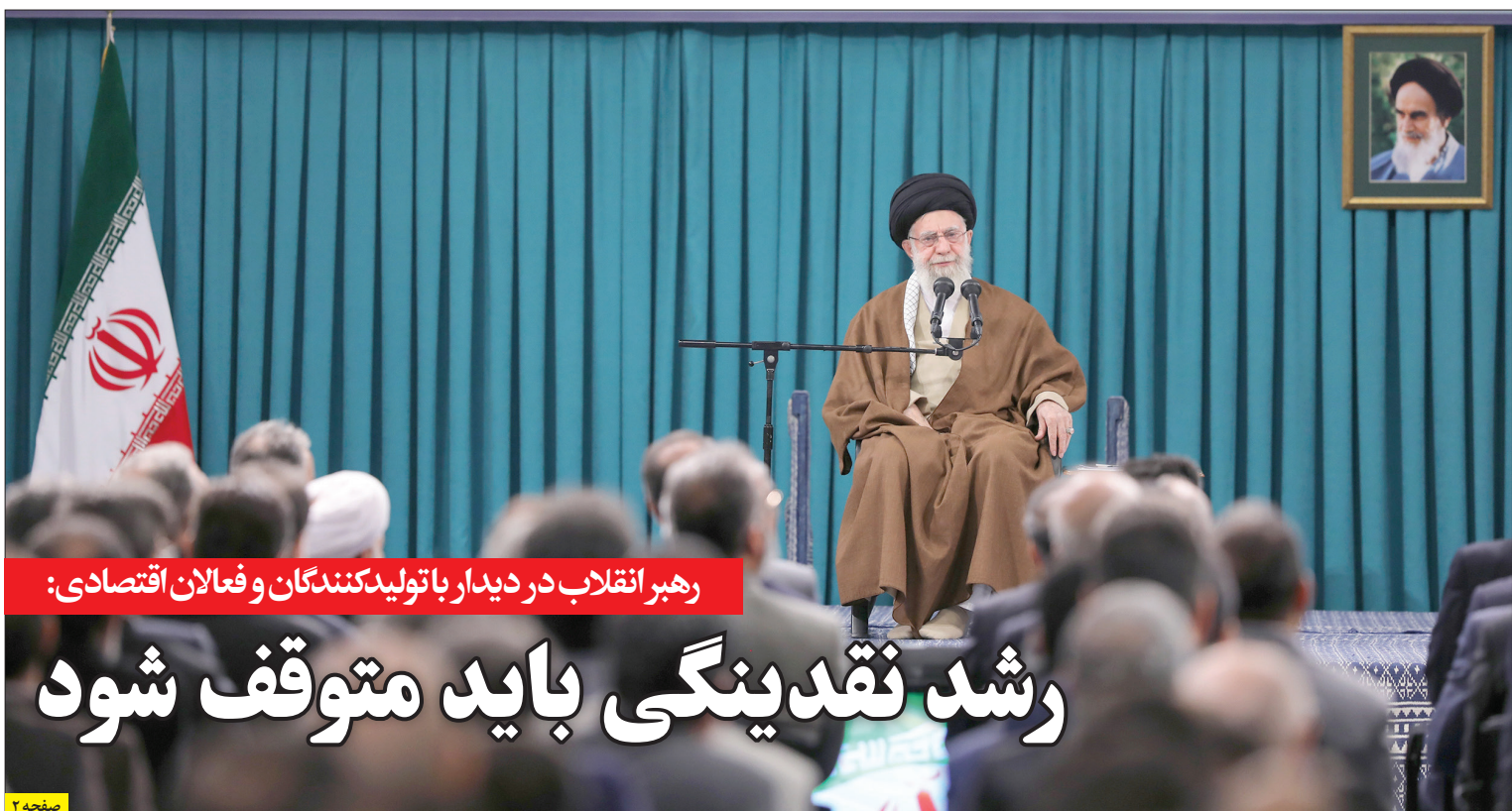
رهبر انقلاب در دیدار با تولیدکنندگان و فعالان اقتصادی: