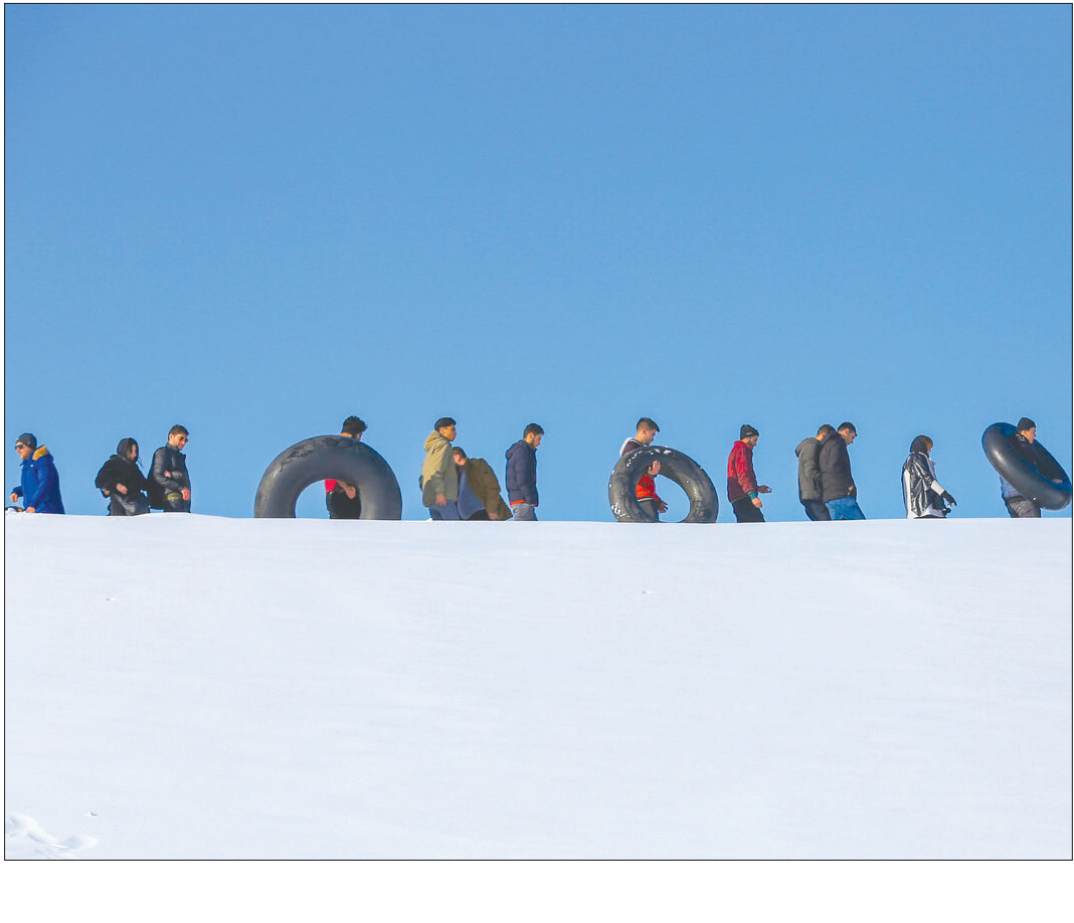
تیوپ سواری در اردبیل

در افرادی که از قبل فشار خون بالایی داشتند، به ویژه کسانی که فشار خون بالا در مرحله ۱ داشتند، مصرف متوسط گوجه فرنگی با کاهش فشار خون همراه بود. این مطالعه شامل ۷۰۵۶ شرکت کننده بود که ۸۲/۵٪ از آنها فشار خون بالا داشتند. آنها در مورد مصرف روزانه گوجه فرنگی خود مورد سوال قرار گرفتند و به چهار طبقه بندی طبقه بندی شدند: کمتر از ۴۴ گرم در روز، ۴۴–۸۲ گرم در روز (متوسط)، ۸۲–۱۱۰ گرم (متوسط روبه بالا) و بیش از ۱۱۰ گرم در روز. نویسندگان این مطالعه کاهش فشار خون دیاستولیک را در کسانی که دارای بالاترین و میزان متوسط مصرف گوجه فرنگی در مقایسه با کمترین میزان مصرف بودند، مشاهده کردند. در شرکت کنندگان با فشار خون بالا مرحله ۱ و مصرف گوجه فرنگی در حد متوسط، فشار خون سیستولیک و دیاستولیک در مقایسه با شرکت کنندگان که کمترین گوجه فرنگی را مصرف می کردند، کاهش یافت.