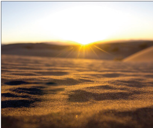
«کویر مصر» سرزمین شن‌های طلایی ایران