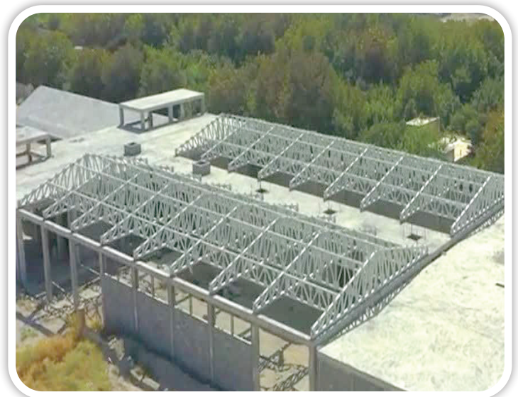
▲ مجموعه ورزشی اندیشه