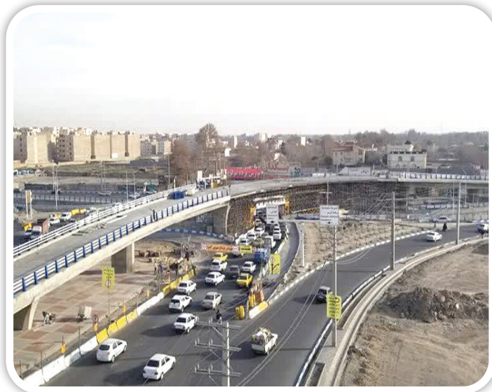
▲ روگذر تقاطع غیرمسطح بسیج