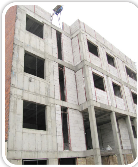
▲ مدرسه ۱۲ کلاسه وائین