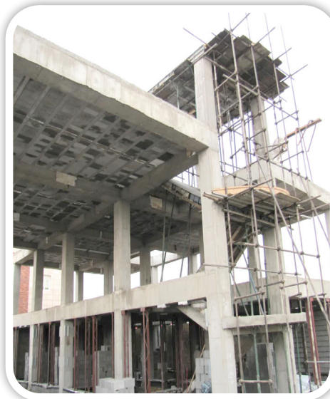
▲ ساختمان آتش نشانی محمدآباد