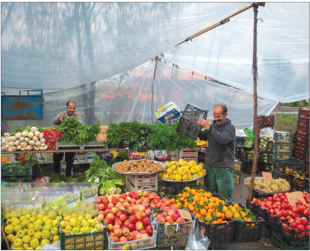
حال خوب در بازار محلی سیاهکل

بیش از ۲۰۰۰ بزرگسال در بریتانیا را بررسی کردند. شرکت کنندگان با استفاده از یک اپلیکیشن موبایل، پرسش نامه های دیجیتالی ماهانه در مورد سلامت روانی و وزن بدن خود را تکمیل کردند. سوالات در این مطالعه علائم افسردگی، اضطراب و استرس درک شده هر فرد را ارزیابی می کرد. نتایج نشان می دهد به ازای هر افزایش تدریجی در نمره افسردگی معمول یک فرد، وزن آنها یک ماه بعد حدود یک دهم، ۰.۵ کیلوگرم افزایش می یابد. می‌تواند باعث افزایش وزن، کم به نظر برسد، اما محققان خاطرنشان کردند