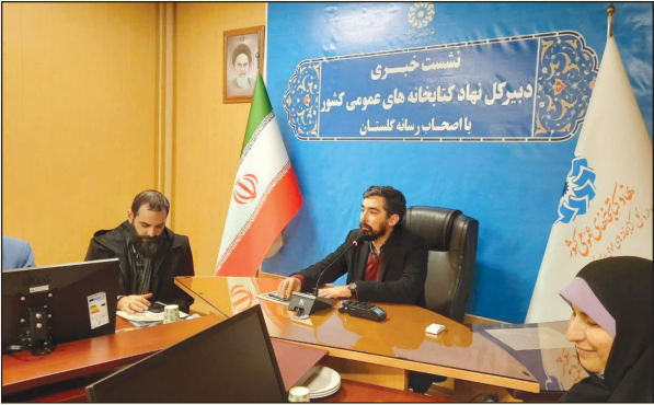
یک کتابخانه مرکزی در استان گلستان است که استان فاقد این