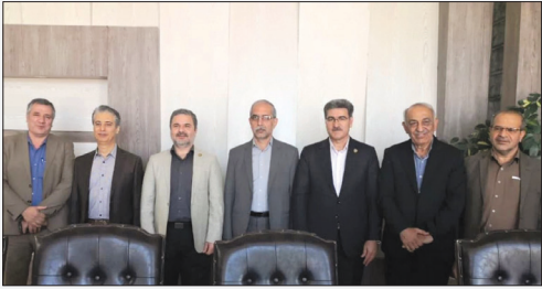
کل صنعت می باشد. رئیس هیات مدیره در پاسخ به ایراداتی که به نرخ های حق بیمه بالای بیمه ایران گرفته میشود تاکید