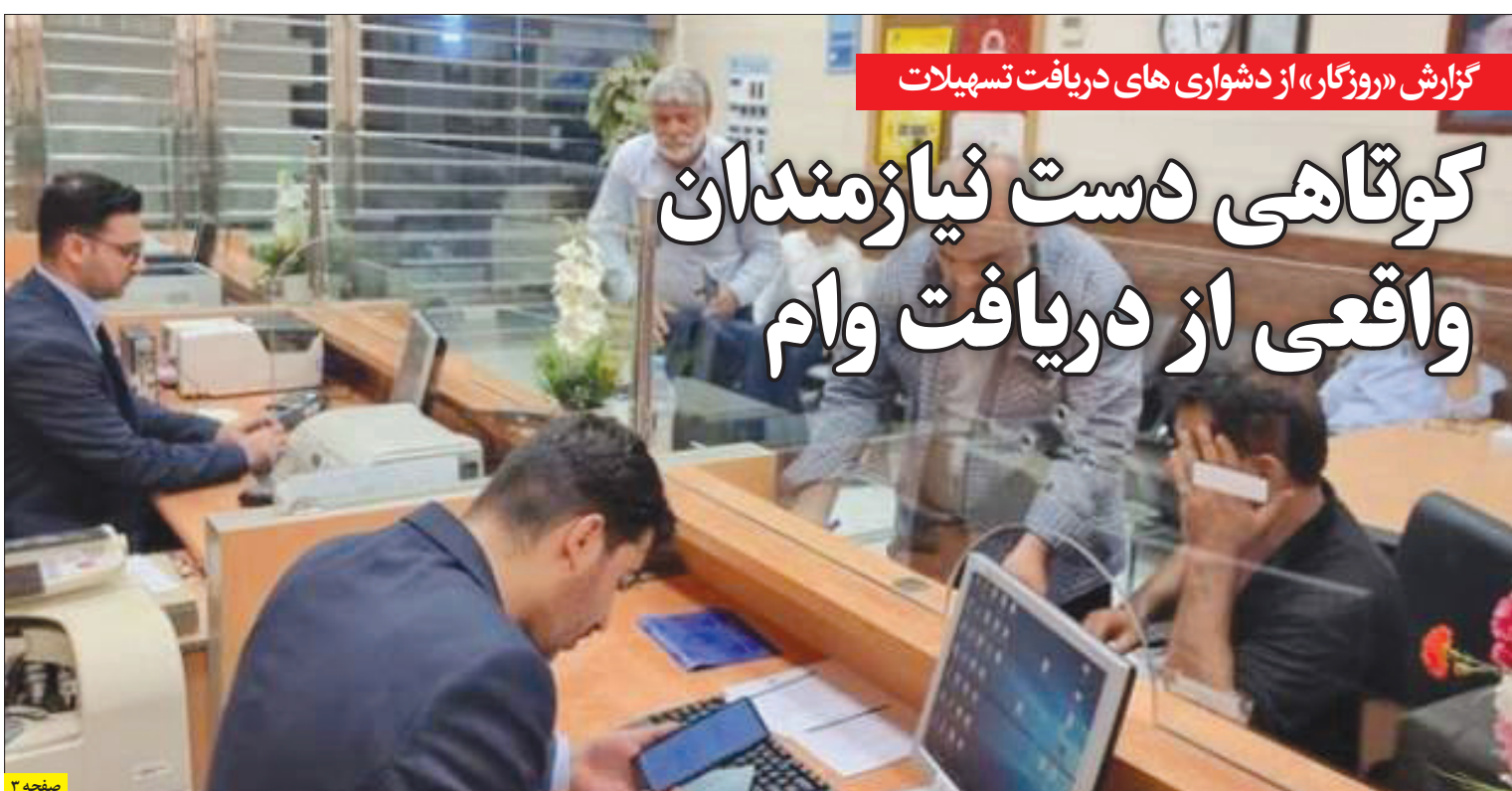
گزارش «روزگار» از دشواری های دریافت تسهیلات