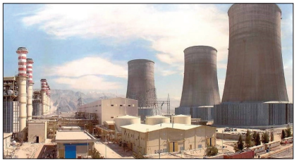
«روزگار» از صرفه جویی ۵۰۰ میلیون دلاری با جایگزینی نیروگاه ها با سیکل ترکیبی گزارش می دهد: