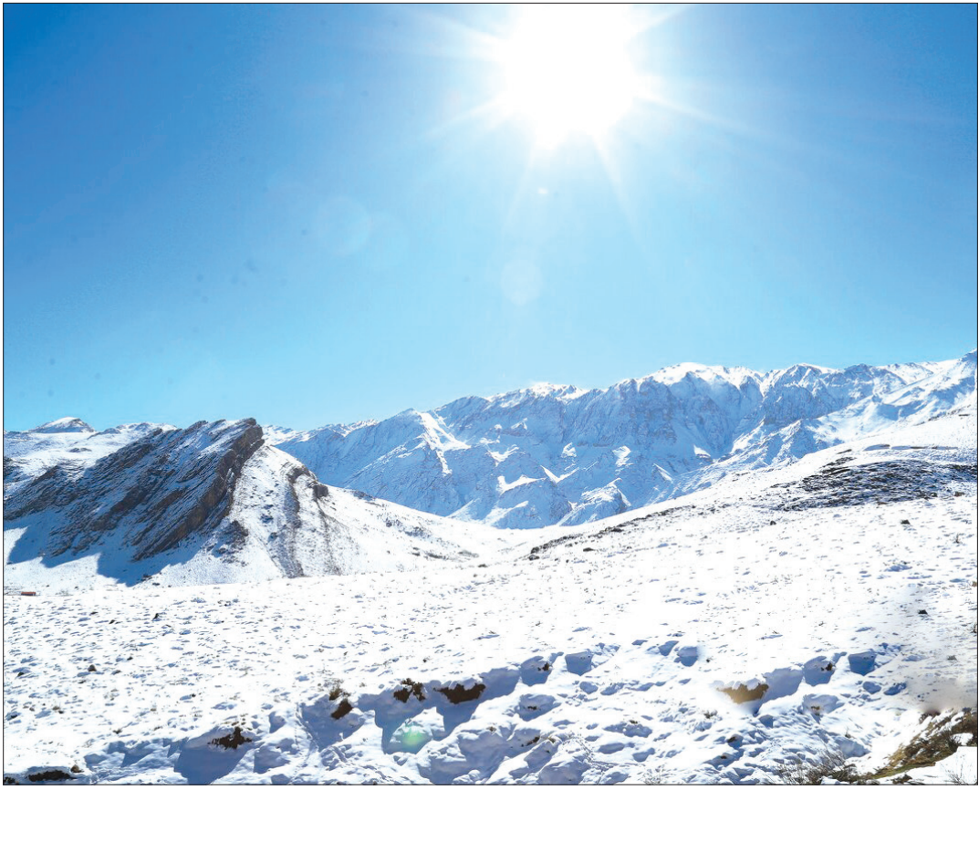
زمستان نیمه جان صمصامی کوهرنگ

در چند سال گذشته محققان نیکوتین آمید آدنین دی نوکلئوتید (NAD+) – یک مولکول مهم که به بدن در ایجاد انرژی کمک می‌کند – را به عنوان یک درمان احتمالی برای بیماری پارکینسون بررسی کرده‌اند. تحقیقات قبلی نشان می‌دهد که افراد مبتلا به پارکینسون ممکن است کمبود NAD+ داشته باشند و افزایش سطح NAD+ ممکن است تأثیر مثبتی