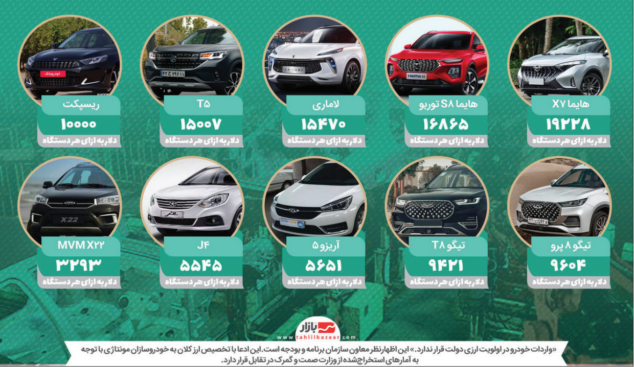
واردات خودرو در اولویت ارزی دولت قرار ندارد. این اظهار نظر معاون سازمان برنامه و بودجه است. این ادعا با تخصیص ارز کلان به خودروسازان مونتازی با توجه به آمارهای استخراج شده از وزارت صمت و گمرک در تقابل قرار دارد.