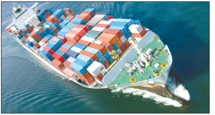
گزارش «روزگار» از تاثیر توسعه تجارت با همسایگان بر اقتصاد کشور