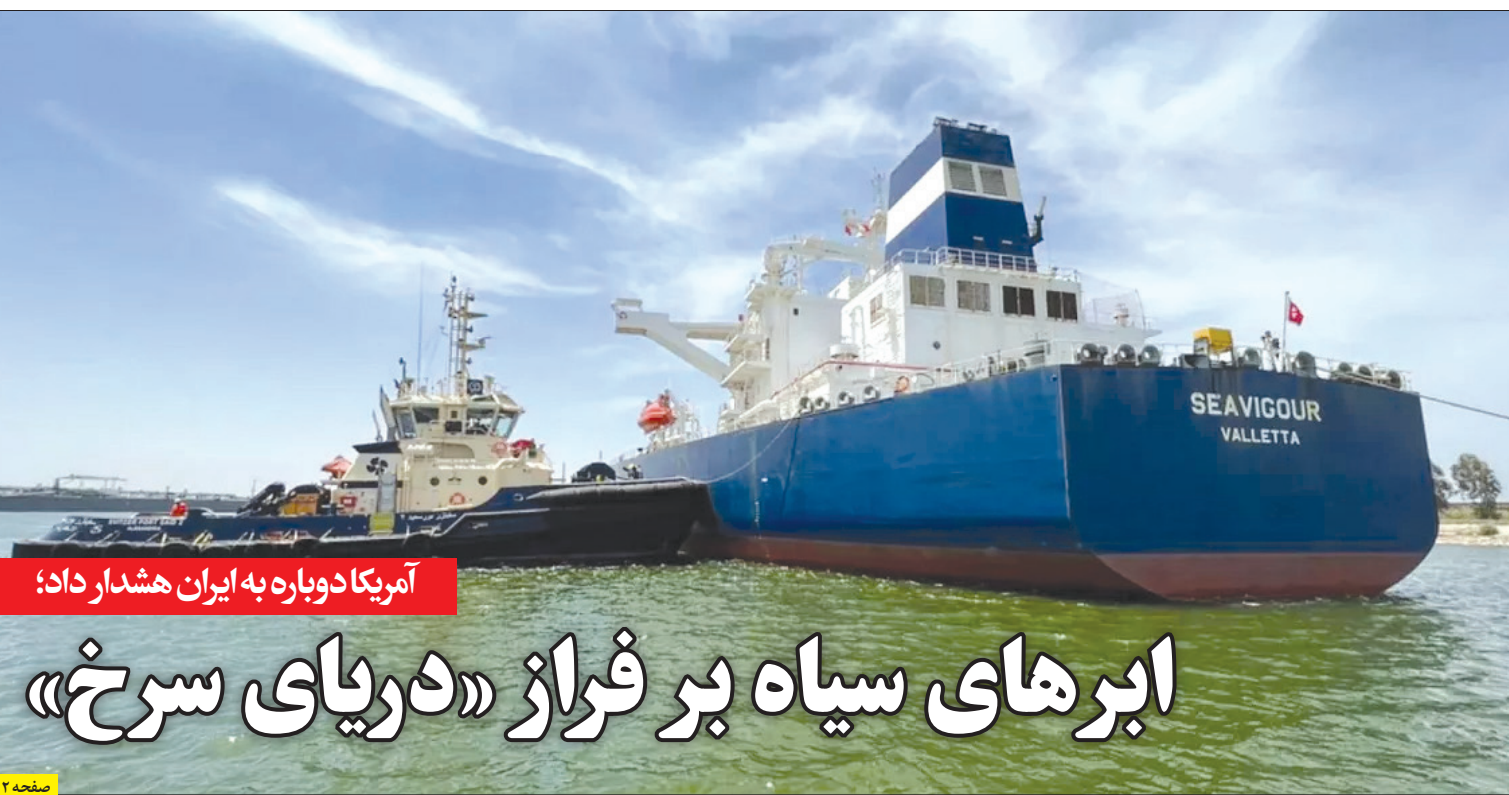
آمریکا دوباره به ایران هشدار داد؛ ابرهای سیاه بر فراز «دریای سرخ»

حادثه تروریستی کرمان اتفاقی غمبار و ناگوار بود. این حادثه، منجر به ایجاد تنش بیشتر در بازارهای مالی جهانی به ویژه بخش انرژی شد. طی روز جمعه و دو روز پس از حادثه تروریستی مذکور، قیمت نفت برنت با ۱.۳۴ دلار یا ۱.۷ درصد افزایش به ۷۸.۹۳ دلار افزایش یافت. در همین حال، نفت وست تگزاس نیز با افزایش ۱.۶۲ دلاری یا ۲.۲ درصدی خود به ۷۲.۸۱ دلار در هر بشکه رسید. اما سوال اینجاست که چرا حادثه تروریستی کرمان تا این حد روی بازارهای انرژی تأثیر گذاشته و قیمت نفت را طی ایام تعطیلات بازارهای مالی تا این حد افزایش داد؟... | صفحه ۲