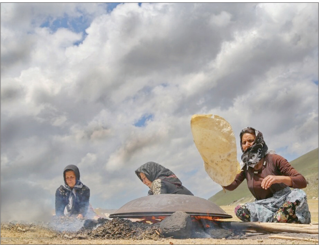
تصاویر زیبا از زنان و مادران زحمت کش آبادی

بازریم غذایی مدیترانه‌ای اثرات منحصر به فردی برای سلامت قلب دارد. دکتر «والتر لوتگو»، محقق ارشد از دانشگاه کالیفرنیا جنوبی، می‌گوید: «رژیم غذایی تقلیدکننده روزه یک رژیم غذایی گیاهی ۵ روزه است و فرد در بقیه ماه، به رژیم غذایی عادی خود برمی‌گردد.» ۵ روز رژیم غذایی تقلید روزه بر روی غذاهای گیاهی کم کالری، کم پروتئین و پرچرب تمرکز دارد. برخلاف رژیم فستینگ متناوب، فردی که رژیم غذایی فستینگ به شیوه تقلید از روزه را دارد، در طول دوره فستینگ هم به