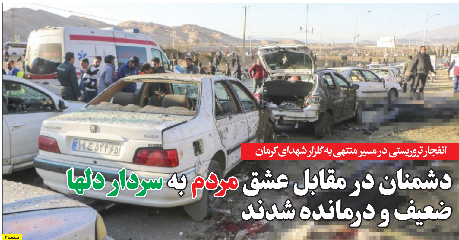
انفجار تروریستی در مسیر منتهی به گلزار شهدای کرمان