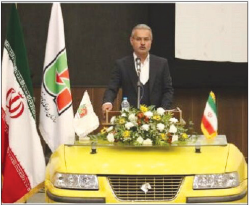
مراسم گرامیداشت هفته حمل و نقل جاده‌ای استان گلستان