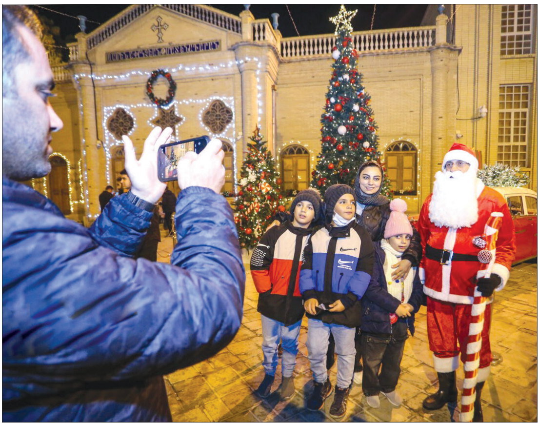
کلیسای وانک در آستانه میلاد حضرت مسیح (ع)