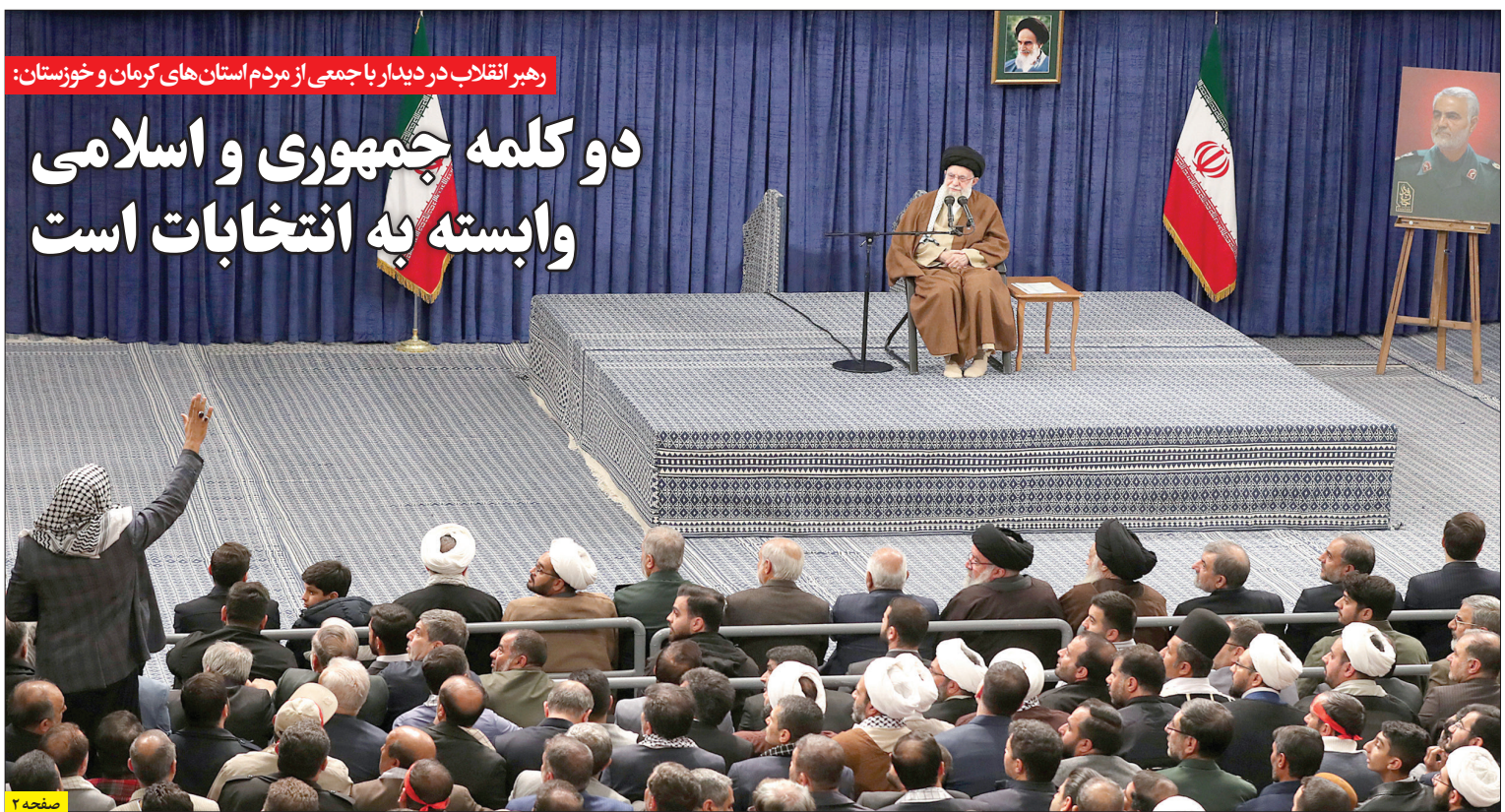
رهبر انقلاب در دیدار با جمعی از مردم استان‌های کرمان و خوزستان