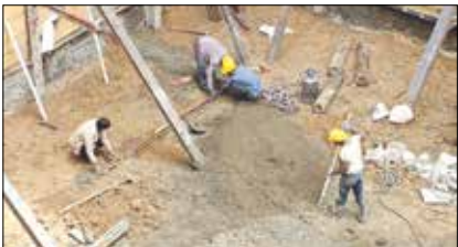
گزارش «روزگار» از رازبانه مخدوش حقوق کارمندان با مزد کارگران