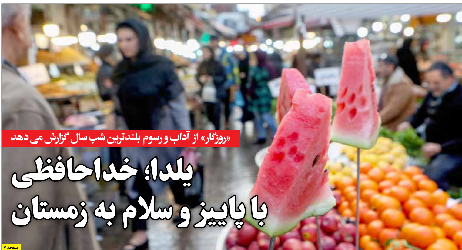
«روزگار» از آداب و رسوم بلندترین شب سال گزارش می دهد