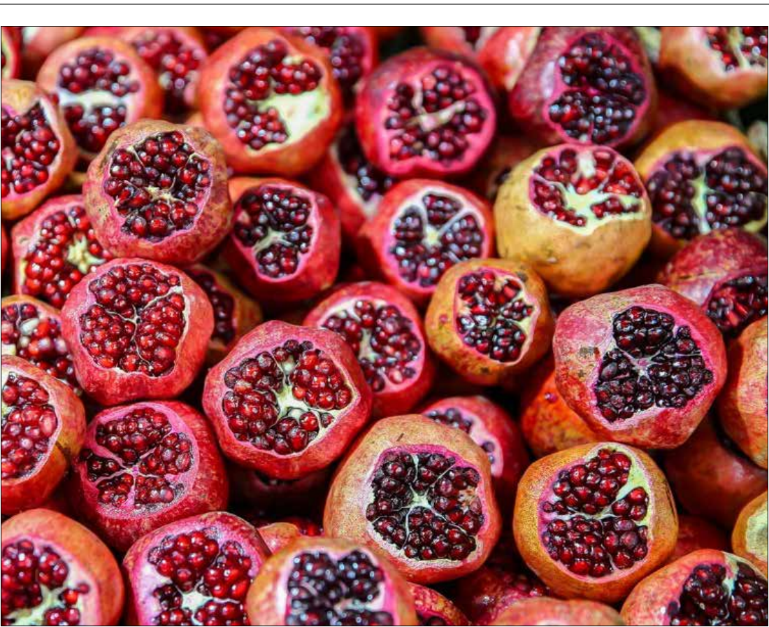
بازار خرید «شب یلدا» در تهران