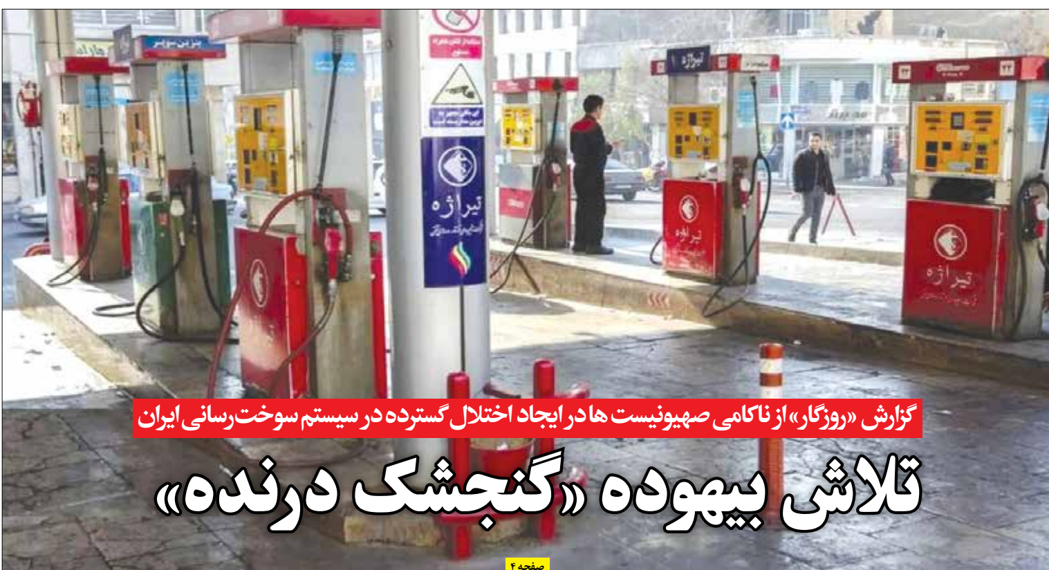
گزارش «روزگار» از ناکامی صهیونیست‌ها در ایجاد اختلال گسترده در سیستم سوخت‌رسانی ایران