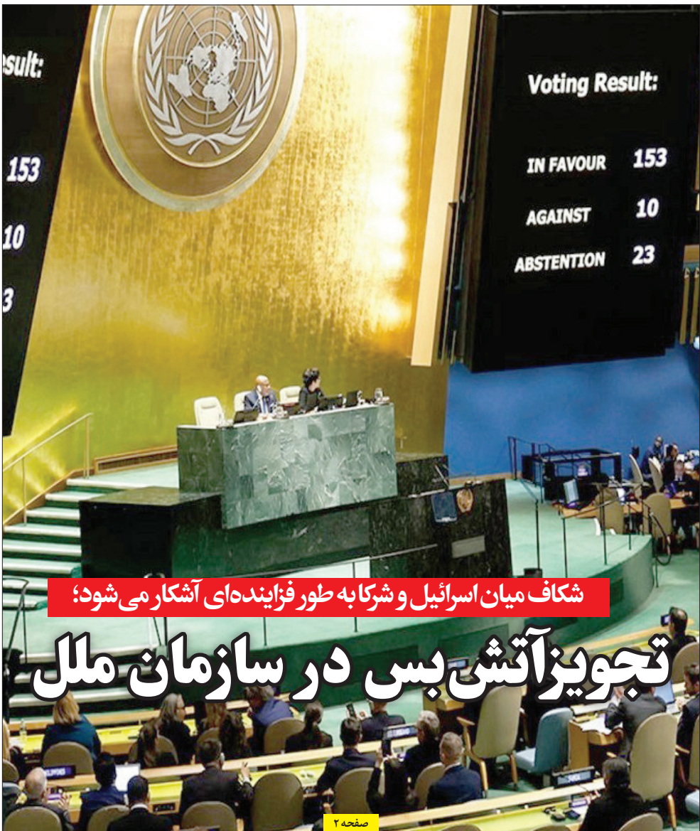
شکاف میان اسرائیل و شرکا به طور فزاینده‌ای آشکار می‌شود؛