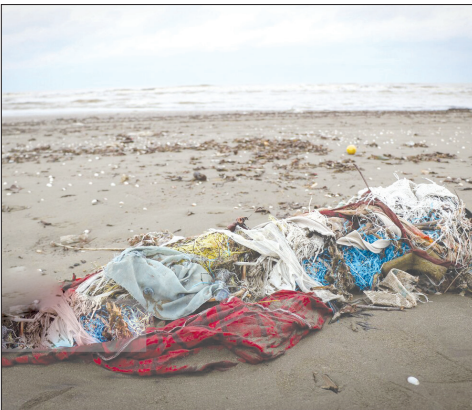
خزر در مرز خفگی!