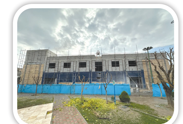
سوله بحران خادم آباد