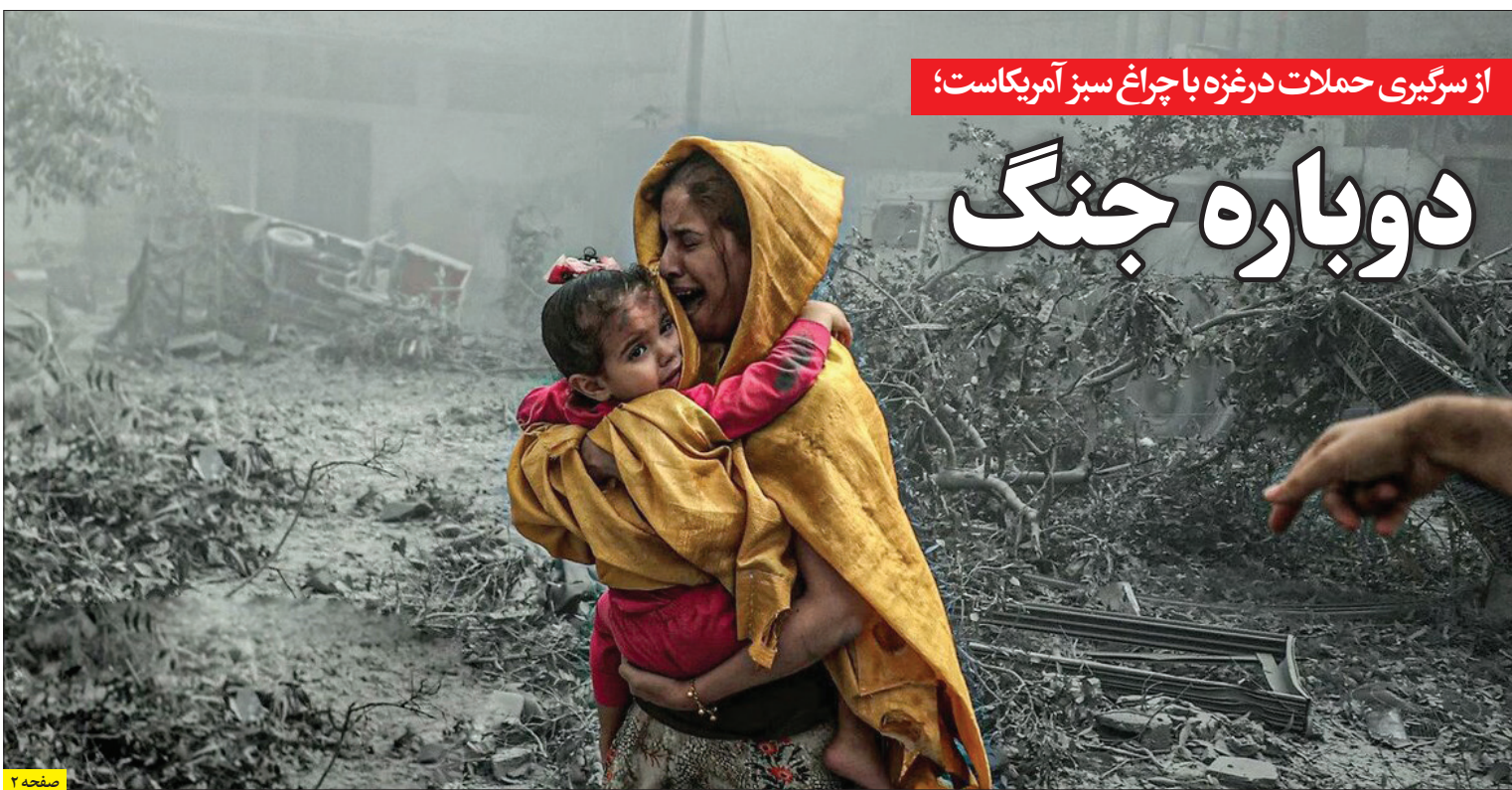
از سرگیری حملات درغزه با چراغ سبز آمریکا است؛

کارشناسان اقتصادی و فعالان اقتصادی برای تثبیت نرخ ارز نظرات متفاوتی دارند که در این گزارش به آن پرداخته شده است. دلار در بازار آزاد هم چنان در کانال ۵۰ هزار تومان در حال نوسان است. برخی از مخالفان تثبیت ارز می گویند برای اینکه التهاب