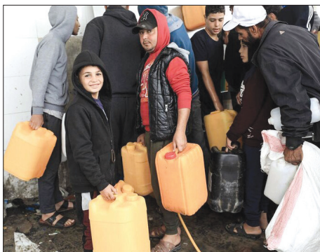
صف دریافت آب تا تانکر در شهر خان یونس در جنوب نوار غزه

رئیس سازمان انرژی اتمی در واکنش به تهدید های اتمی نخست وزیر رژیم صهیونیستی، تأکید کرد: مسوولیت هر گونه اتفاق برعهده رژیم صهیونیستی است. محمد اسلامی رئیس سازمان انرژی اتمی در حاشیه نشست هیأت دولت در جمع خبرنگاران، اظهار داشت: مسئولیت هر گونه اتفاق برعهده رژیم صهیونیستی است، زیرا رژیم صهیونیستی آن بی تی و پادمان را امضا نکرده است و امروز این رژیم در حال تهدید جهان با بمب اتمی است. وی افزود: قبل از جلسه شورای حکام طی نامه ای به مدیر کل آژانس بین المللی انرژی اتمی به وی گفتیم که وزیر رژیم صهیونیستی به صراحت، فلسطینی ها را تهدید به استفاده از سلاح هسته ای کرد. رئیس سازمان انرژی اتمی تصریح کرد: همچنین نخست