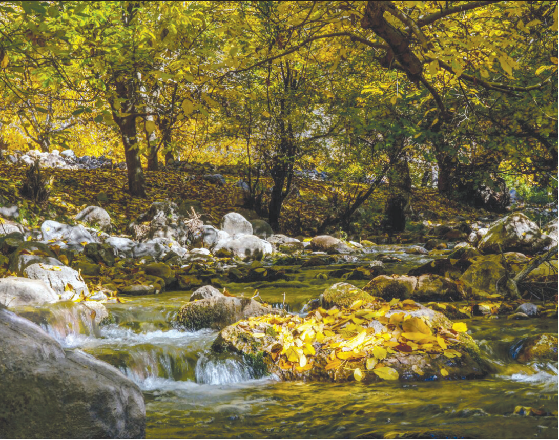
پاییز در سلسله

به گفته محققان، این رابطه در مردان بدتر از زنان بود و اندازه‌گیری چربی احشایی بالاتر نیز با افزایش التهاب در مغز مرتبط بود. دولت‌شاهی گفت: «ترشحات التهابی چربی احشایی، برخلاف اثرات بالقوه محافظتی چربی زیر جلدی، ممکن است منجر به التهاب در مغز شود که یکی از مکانیسم‌های اصلی در ابتلا به بیماری آلزایمر است.»