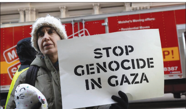
تجمع گروهی از حامیان فلسطین در شهر نیویورک، روزا