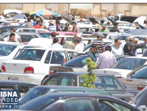
مشاوران صنایع حمل و نقل وزارت صمت

معاونت صنایع حمل و نقل وزارت صمت، گزارشی از کاهش خودروهای پرتیراژ در بازار خودروی کشور ارائه کرده که آن را نتیجه اصلاح قیمت خودروها در فروردین ماه سال جاری (پس از نزدیک به یک ماه و نیم ثابت ماندن قیمت کارخانه‌ای محصولات) دانسته است.