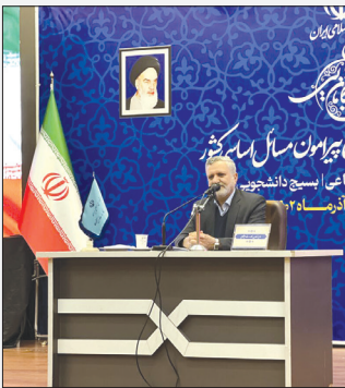
رئیس هیئت مدیره سازمان امور مالیاتی کشور در نشست خبری

نساء کرونوی/گروه اقتصاد نخستین جمعه پس از روز شکرگزاری در آمریکا را بلک فرایدی یا جمعه سیاه می‌نامند، از این روز به طور غیر رسمی خرید های پایان سال آغاز شده و مردم با خرید برای جشن پایان سال آماده می‌شوند. فروشگاه‌ها نیز در این روز با اعمال تخفیف بسیار بالا بر روی کالای خود مردم را ترغیب به خرید می‌کنند. اینکار سبب می‌شود هم مشتریان با سطح مالی متوسط و ضعیف بتوانند کالای مورد نیاز خود را خریداری کرده و هم انبار فروشگاه‌هاشان در پایان سال خالی شود. در صنعت تبلیغات نیز بلک فرایدی کولاک کرد و فروشگاه‌ها با برخی تخفیفات سبب شد بعضی فروشگاه‌ها در یک روز در آمد یکساله داشته باشند و در بین برندهای دیگر نیز شاخص شوند. این روز سال به سال گسترش پیدا کرد و به کشورهای دیگر از جمله ایران سرایت کرد.