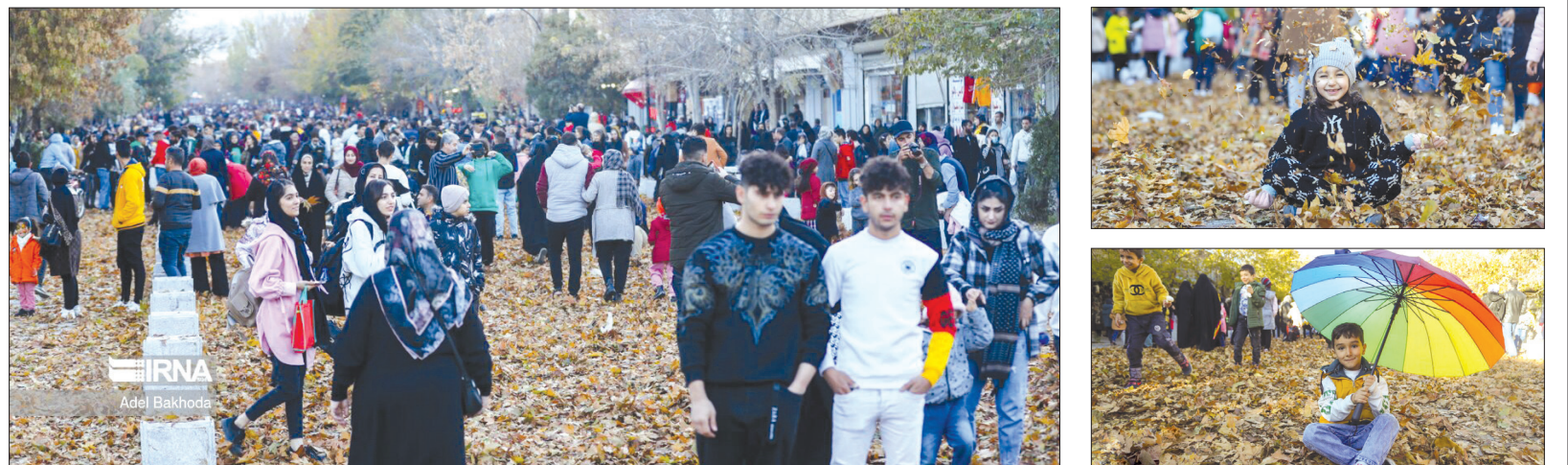
جشنواره برگریزان هکمتانه