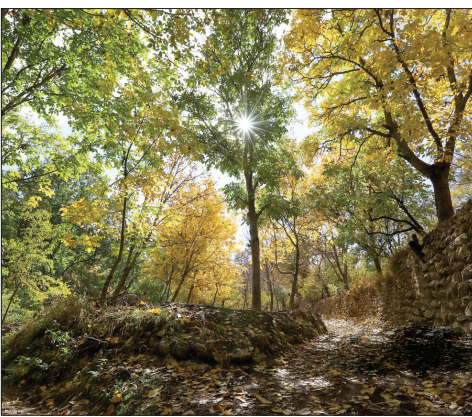
پاییز روستای وفس، ماسوله استان مرکزی