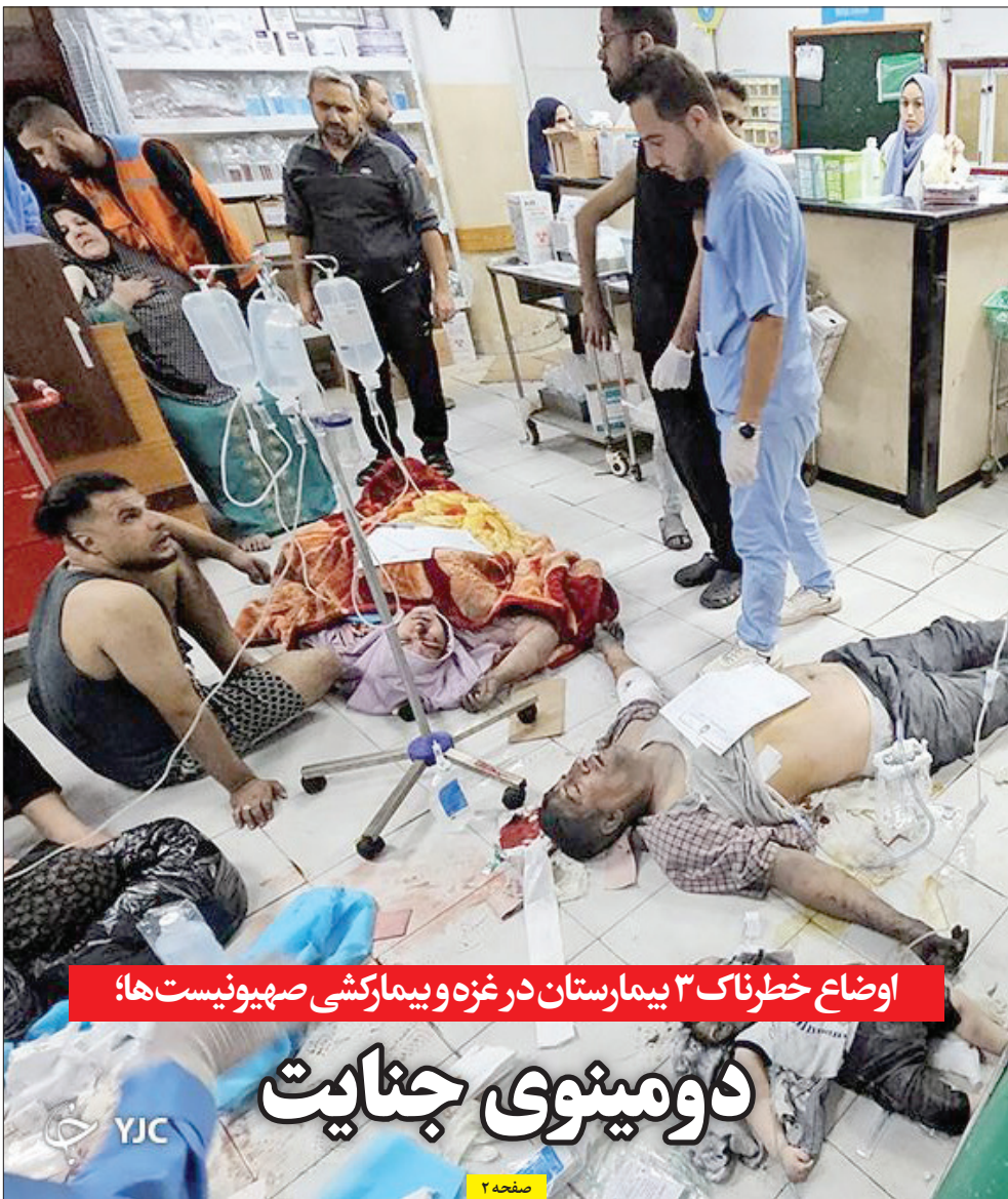
اوضاع خطرناک ۳ بیمارستان در غزه و بیمارگشی صهیونیست‌ها؛