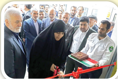
خانم خواست خدایی