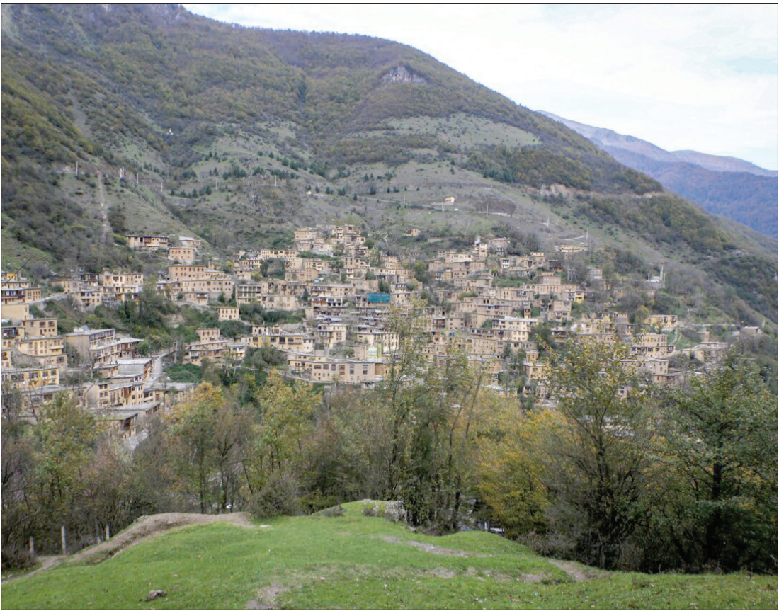
ماسوله قطعه‌ای از تاریخ گیلان

معناست که به ازای هر ۱۰۰۰۰ کودکی که سی‌تی اسکن انجام می‌دهند، می‌توان انتظار داشت که در ۱۲ سال پس از معاینه حدود ۱ تا ۲ مورد سرطان مشاهده شود. « برای این مطالعه، محققان از ۹ کشور اروپایی - بلژیک، دانمارک، فرانسه، آلمان، هلند، نروژ، اسپانیا، سوئد و بریتانیا - منابعی را برای بررسی خطر سی‌تی اسکن در کودکان گردآوری کردند. محققان در یادداشت‌های پس‌زمینه گفتند، استفاده گسترده از سی‌تی اسکن در دهه‌های اخیر به نگرانی‌هایی در مورد خطرات سرطان مرتبط با قرار گرفتن در معرض تابش، به ویژه در بیماران جوان منجر شده است. کودکان نسبت به بزرگسالان به تشعشع بسیار حساس‌تر هستند، پس از دریافت اسکن در سنین جوانی احتمال بیشتری دارد که اثرات آسیب ناشی از پرتو بر سلامتی را تجربه کنند.