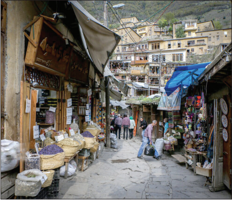
ماسوله قطعه‌ای از تاریخ گیلان