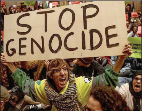
تظاهرات بزرگ حامیان فلسطین در شهر بارسلونا اسپانیا/روزما

نماینده مردم نجف آباد در مجلس شورای اسلامی تصریح کرد: در اصلاح قانون انتخابات مجلس شورای اسلامی آمده است هر داوطلبی که به نتیجه بررسی صلاحیت‌ها اعتراض دارد، حق داشتن وکیل و دفاع کتبی از خودش را دارد و این موضوع کاملاً مبنی بر حقوق شهروندی و دموکراسی است.