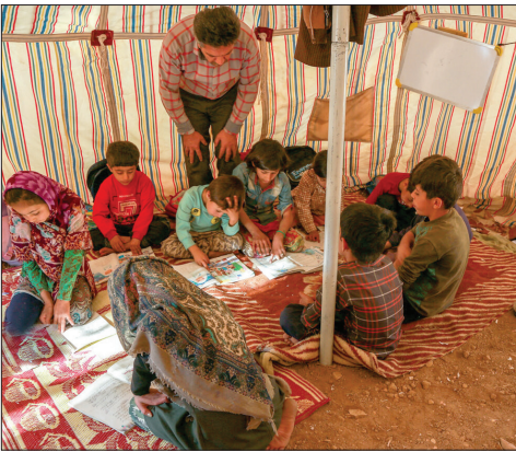
مدرسه عشایری «بازفت»