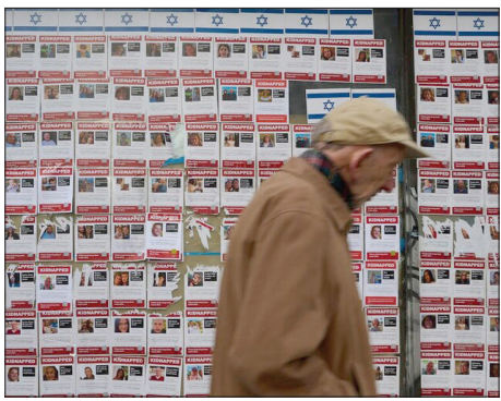
طرفداران اسرائیلی عکس های اسرای اسرائیلی در دست حماس را در دیوارهای شهر نیویورک نصب کرده اند.