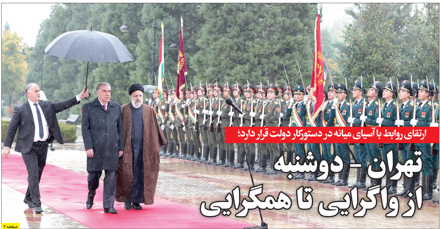
ارتقای روابط با آسیای میانه در دستورکار دولت قرار دارد؛