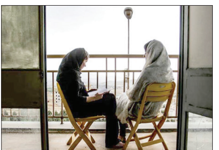
چینی نازک دل دختران را مرهمی باید