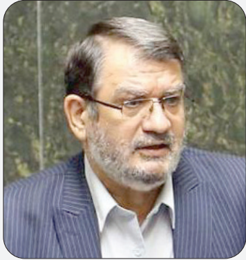
عبدالحسین روح الامینی، نماینده مردم تهران: