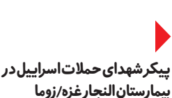
پیکر شهدای حملات اسرائیل در بیمارستان التجار غزه