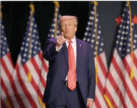
ترامپ در جمع حامیانش در ایالت آیووا آمریکا

مقاومت فلسطین اعلام کرد که برای سربازان اشغالگری که در صدد نفوذ به نوار غزه هستند، کمین هایی ایجاد کرده و در چندین منطقه با آنها درگیر شده است. همچنین حملات موشکی و خمپاره ای جنبه مقاومت به شهرهای اشغالی و مواضع صهیونیست ها ادامه دارد.